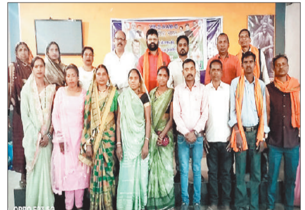
कार्यशाला में शामिल अतिथि व अन्य।