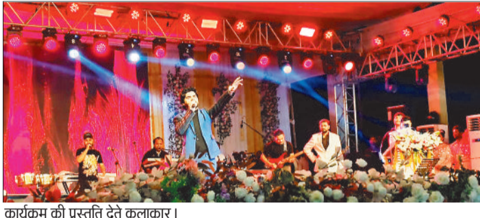
कार्यक्रम की प्रस्तुति देते कलाकार।