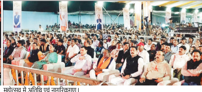
महोत्सव में अतिथि एवं नागरिकगण।

हरिभूमि न्यूज ►► कोरबा ऐतिहासिक नगरी पाली में महाशिवरात्रि के पावन अवसर पर पाली महोत्सव 2026 का शुभारंभ शिव आरती, दीपोत्सव और भव्य आतिशबाजी के साथ हुआ। हजारों श्रद्धालुओं की उपस्थिति में शाम लगभग 7 बजे पाली शिव मंदिर घाट में शिव आरती और दीपोत्सव ने समां बांध दिया। पाली के