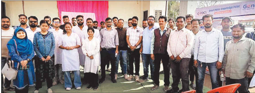
नुककड़ नाटक कर जागरूकता अभियान चलते हुए।

उल्लेखनीय है कि जिले में लगभग 2 लाख से अधिक उपभोक्ताओं के घरों में स्मार्ट मीटर लगाया जाना है जिसमें से आधे उपभोक्ताओं के घरों में ही स्मार्ट मीटर पहुंच पायी है जबकि इसका टाईम लाइन समाप्ति की ओर है। तय समय के भीतर कंपनी ने स्मार्ट मीटर लगाने का काम पूरा नहीं कर पायी है और लगातार काम पिछड़ता ही जा रहा है जिसे देखते हुए अब स्मार्ट मीटर की सुविधा का लाभ उठाने के लिए छत्तीसगढ़ स्टेट पावर डिस्ट्रीब्यूशन कंपनी उपभोक्ताओं