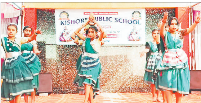
कार्यक्रम की प्रस्तुति देती छात्राएं।

ग्राम पंचायत फरसवानी में संचालित किशोर पब्लिक स्कूल में धूमधाम से वार्षिकोत्सव कार्यक्रम सम्पन्न हुआ। इस अवसर पर मुख्य अतिथि के रूप में जनपद अध्यक्ष श्रीमती अशोक कंवर उपस्थित रही। सर्वप्रथम अतिथियों ने कार्यक्रम का शुभारंभ राष्ट्रगीत और राष्ट्रगान के साथ मां सरस्वती के तैल चित्र पर दीप जलाकर माल्यार्पण और पूजा अर्चना कर किया। तत्पश्चात सभी अतिथियों का स्वागत तिलक वंदन और बैज लगाकर किया गया। वार्षिकोत्सव कार्यक्रम में कक्षा नर्सरी से लेकर कक्षा आठवीं तक के बच्चों ने भाग लिया। इस कार्यक्रम के सफल आयोजन में स्कूल के छात्रों, शिक्षकों, और